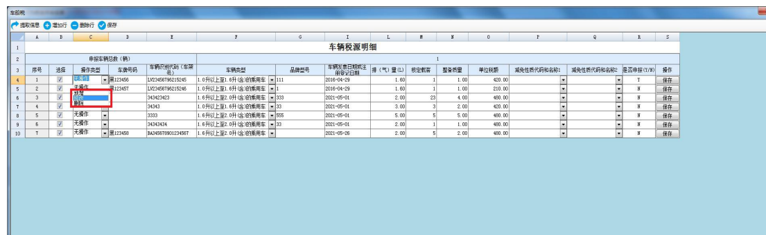
图 车船税税源信息修改界面

如税源已经申报过，应当先作废申报再作废税源信息；如税源未申报过，通过【操作类型】下拉选择【修改】，根据需要修改相关信息。修改完毕后点击最右侧操作列的【保存】按钮，系统提示保存成功。如下图所示：