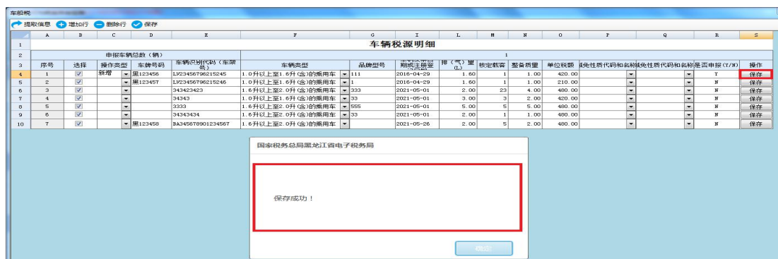
图 车船税税源信息修改保存成功界面