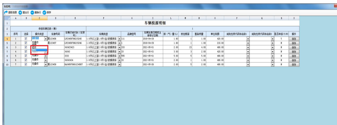
图 车船税税源信息删除界面

如税源已经申报过，应当先作废申报再作废税源信息；如税源未申报过，通过【操作类型】下拉选择【删除】，然后点击最右侧操作列的【保存】按钮，系统提示保存成功，税源删除完毕。如下图所示：